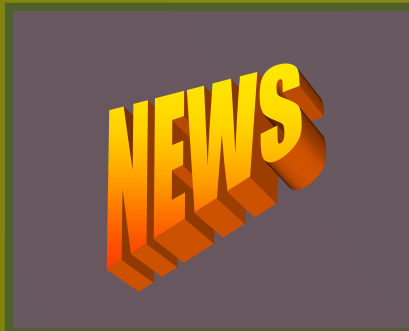
CreaNews: Novedades del Mundo Creativa