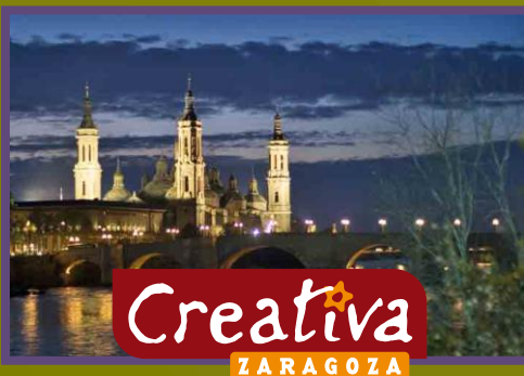
Esperando Zaragoza: La nueva ciudad Creativa