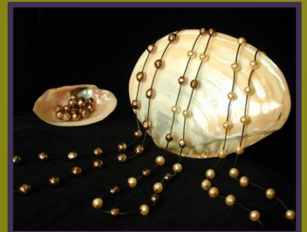
Ideas Creativas: ¡Un otoño de novedades!