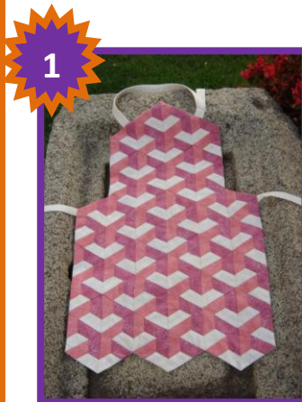
Más Cubos Mª Pilar Olives

Tres delantales han sido los premiados por el público de la web Creativa y el jurado de la AEP, valorándose la creatividad y complejidad técnica de los trabajos presentados.